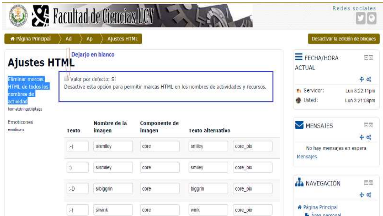
Figura 2. Ajustes HTML

Ejemplo: Títulos (en las etiquetas y dentro de los recursos y/o actividades y bloque, el tamaño de letra se coloca con el editor HTML).