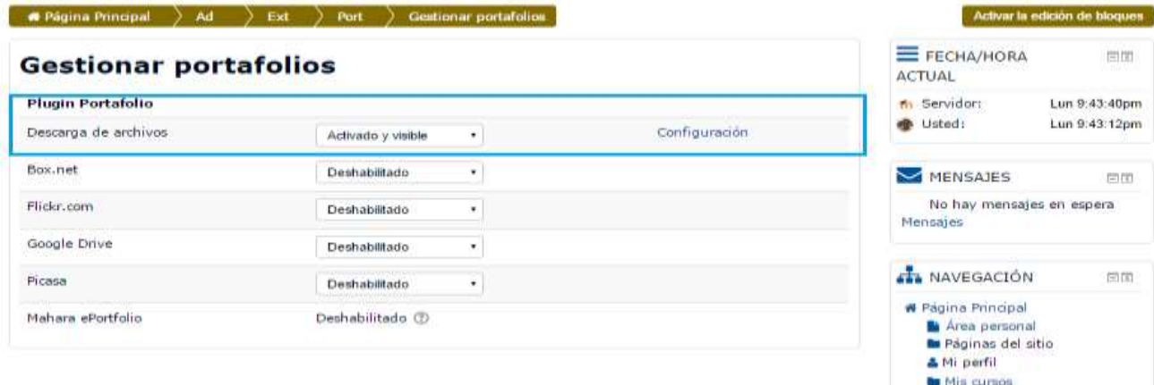
Figura 2. Extensiones. Gestionar Portafolios.